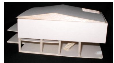
Maqueta sistema esqueletal