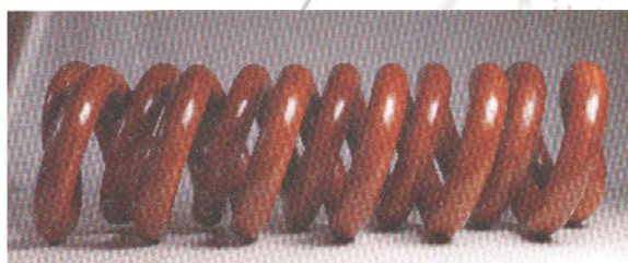
Elementos característicos del arquitecto